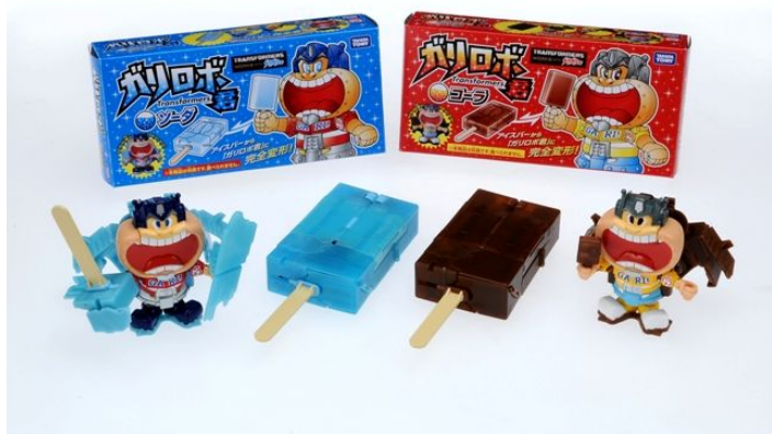
『ガリロボ君(ソーダ/コーラ)』 希望小売価格 各1,890円/税込 ※「アイスキャンディーモード」と「ロボットモード」