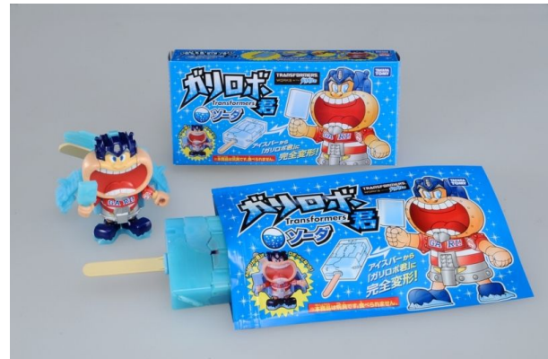
『ガリロボ君 ソーダ』(商品) ※「アイスクャンディーモード」と「ロボットモード」

『ガリロボ君』は、トランスフォーマーの「ロボットが身の回りにある、ありとあらゆる物体に自由自在に変形し、潜んでいる」というコンセプトをアイスクャンディーで表現し、子どもから大人まで人気の氷菓に親しみを持つ多くの方々に興味を持ってもらうことを意図し企画しました。数あるトランスフォーマーの中でも初めての、食品をモチーフとした商品となります。