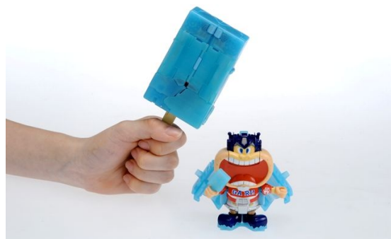
「アイスキャンディーモード」と「ロボットモード」

＜報道各位から本件に関するお問い合わせ先＞ 株式会社タカラトミー 広報部 TEL 03-5654-1280/FAX 03-5654-1380